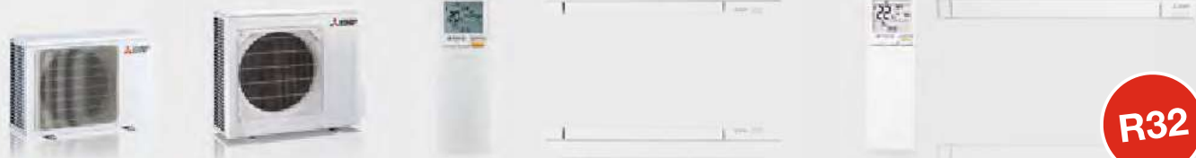
MUZ-AP20VG / AY25-42VG